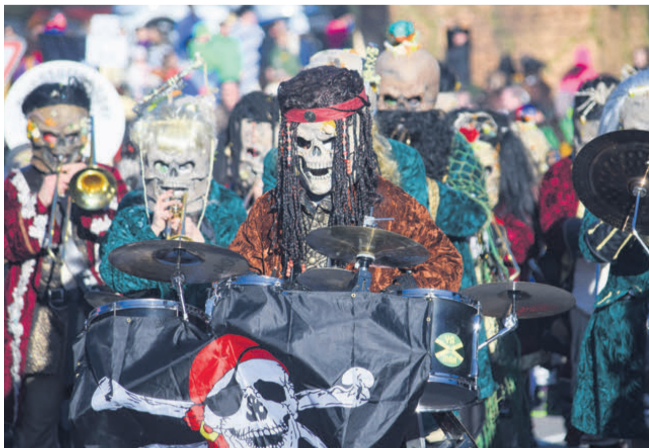
Die Wagenbaugruppe Schenkastico setzt sich weiterhin für die Durchführung des «A-PFEFF» ein.

Der «A-PFEFF» 2024 brachte mit vielen Programmpunkten, einem engen Zeitplan und personell begrenzten Mitteln die eine oder andere Herausforderung mit sich, welche die kleine Kulturfasnachtgruppe Schenkastico mit Bravour meisterte: «Ohne unsere freiwilligen Helfenden und deren bezahlten Einsatz wäre dieser Anlass